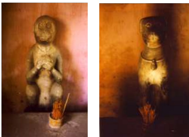
Hình 9. Tượng Khỉ hai tay cầm trái đào, trên « cầu Nhật Bản » (Hội An). Tượng Chó cổ đeo chuông, đối diện với tượng trước. Hai bức tượng này đều bằng gỗ thếp sơn, chấu dùng để ghi thời điểm dựng và hoàn tất cầu. Ảnh Patricia Marcel, 1993.

Giống như thú chó này, là con chó « độc » được đặt một bên phía cầu-nhà ở Hội An (tục gọi là « cầu Nhật Bản »), đối diện với tượng khỉ phía bên kia (mà nhiều người trông lầm thành con chó). Nhưng chắc đây không phải là thú chó đá thờ ở Việt Nam, mà có ý nghĩa khác. Tượng truyền, chiếc « cầu Nhật Bản » này được khởi công năm Thân (tức năm con Khỉ) và được hoàn tất hai năm sau, vào năm Tuất (tức năm con Chó). Cho nên, hai con vật này biểu tượng cho mốc thời gian, chứ không có nhiệm vụ đuổi ma, trừ tà, nhất là khi hai tượng được đặt « chiếu tương » lẫn nhau. Và lại, đây không phải là hiện tượng « thờ chó đá », vì một lý do thật giản dị : hai bức tượng Khỉ và Chó trên chiếc « cầu Nhật Bản » này là tượng gỗ, thếp sơn, chứ không phải là tượng đá. Tượng gỗ, thờ nơi có mái che, tránh mưa tránh nắng. tượng đá mới là tượng phơi sương dãi nắng, và chó đá chính là chó nằm ngoài nhà, giữ cửa.