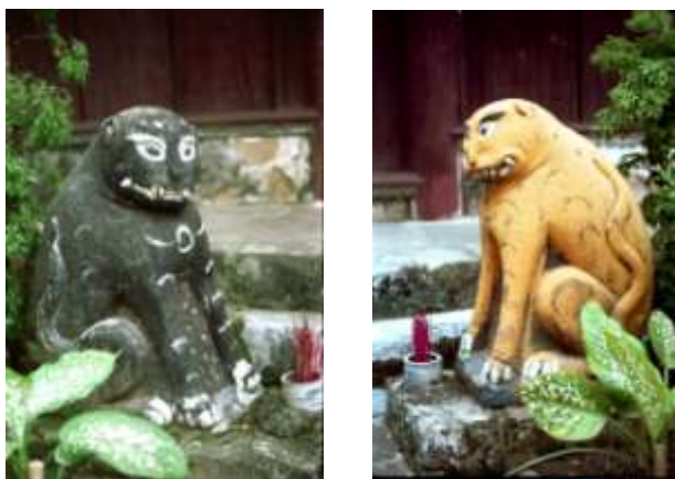
Hình 7. Tượng hai chó đá trước cửa đình làng Phù Diễn, Thanh Oai, ngoại thành Hà Nội, một con sơn xám, con kia sơn vàng, dáng cứng và thô. Ảnh Đ.T.H., 1994.