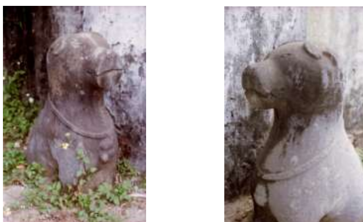
Hình 8. Hai chó đá được chôn sâu trước cửa chùa làng Phượng Vũ, bằng đá vôi xám. Ảnh Đ.T.H., 1996.

Khác hẳn với đôi chó đá hai bên cửa chùa ở làng Phượng Vũ, trước thuộc Hà Đông. Đôi chó này rất đẹp, được tạc trên đá vôi xám, dáng điệu mạnh mẽ. Đôi tai ép lên đỉnh đầu, mõm cụt lùn phô chiếc mũi hung tợn, trông đúng là giống chó vừa khỏe, vừa dữ, cổ đeo một chiếc chuông nhạc to. Rất tiếc là bữa ấy đi vội qua làng, nên không kịp hỏi thêm sự tích đôi chó đá này, vì chúng được chôn sâu hai bên cổng vào nhà chùa, một nơi mà nay không qua lại, thay vì được đặt ngay trên nền cổng. Rất có thể chôn sâu như thế là để tránh bị kẻ trộm khênh đi.