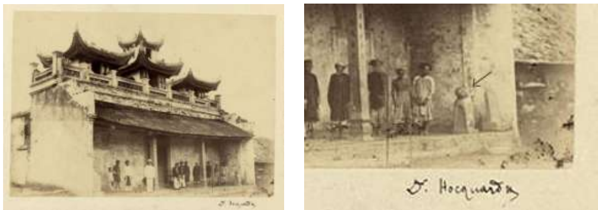
Hình 1. Tượng chó đá trước cửa đền ở Nam Định (bên phải : chi tiết). hè 1884.

Năm 1919, linh mục Léopold Cadière mô tả hai bức tượng loại chó « độc » này ở Nam-phổ Đông (thuộc huyện Phú-Vang, Thừa-Thiên) : « Ở đầu hai ngã đường vào làng, người ta đã đặt trên bệ thờ xây bằng gạch hai con chó đá to chừng nửa thước, bề cao cũng như chiều dài. Con chó thứ nhất được đẽo thô sơ bằng đá phiến. Tượng này dùng để bảo vệ những nhà ở phía sau, hầu tránh được điều dữ [...]. Người ta đồn rằng pho tượng rất thiêng, và được thiên hạ kính cẩn nhang thờ giữa những vòng hoa, những chiếc bình vôi đã bỏ và những ông đồ rau » (L. Cadière, IV, « Pierres, buttes, et autres obstacles magiques - Phiến đá, mỏm đất và những chướng ngại hiển linh khác », BÉFEO , Tập 19, 1919, tg. 63). Tượng thứ nhì, được đẽo cẩn thận hơn, nhưng lại không mỹ thuật bằng và không giống lắm. Tượng xoay đầu về hướng đường từ bờ lạch đi lên, nơi ấy chung quanh là bãi tha ma. Chức năng của bức tượng là để khử những ảnh hưởng xấu xuất phát từ con đường này và từ la liệt những ngôi mộ. [...] Tượng này cũng nổi tiếng ngang như tượng trước, và cũng được dân chúng kính cẩn thờ. Cả hai đều là « Thần-cầu » ( sách đã dẫn , tg. 64).