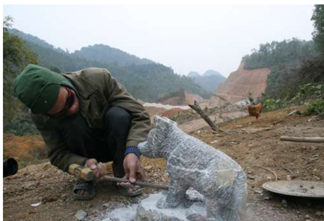
Hình 12. Lắm khi gia chủ cầm chiếc búa và dùi tay tạc chó đá.