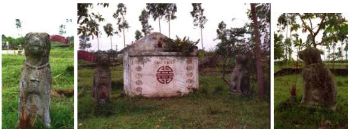
Hình 6. Đôi chó đá khổng lồ, đặt hai bên ban thờ thổ thần trong nghĩa trang làng Đại Từ.

Đó đây, rải rác ở nhiều nơi, tôi đã thấy nhiều mẫu chó đá mà dân gian trịnh trọng thờ cúng, như tượng đôi chó đá khổng lồ, cao ngót một thước và được đeo trong phiến đá hoa cương xám, gắn liền với chiếc bệ ở dưới. Cặp chó này ngồi thản nhiên trên hai chân sau, hai chân trước chống thẳng, đây là dáng điệu phổ biến trong ngành điêu khắc dân gian của thứ chó trông hiền lành nhưng sẵn sàng nhảy xổ ra xua đuổi kẻ xấu. Cổ chó đeo nhạc ở hai bên cạnh và một thứ chuông nhạc lớn ở giữa, báo hiệu giống chó thật dữ, cần tránh xa. Chó được đặt hai bên ban thờ thổ thần trong một nghĩa trang thuộc ngoại thành Hà Nội. Một bát hương được kính cẩn đặt trước tượng chó đá. Thật lạ và đáng ghi nhận là những tượng chó này hoàn toàn không giống bóng dáng con Vàng, con Vện, con Mực thường thấy trong làng mạc, mà lại giống một thứ chó lạ, trông vẻ đáng sợ và hung bạo hơn loại chó ta, dù chúng được tạc trong tư thế ngồi và hiền lành.