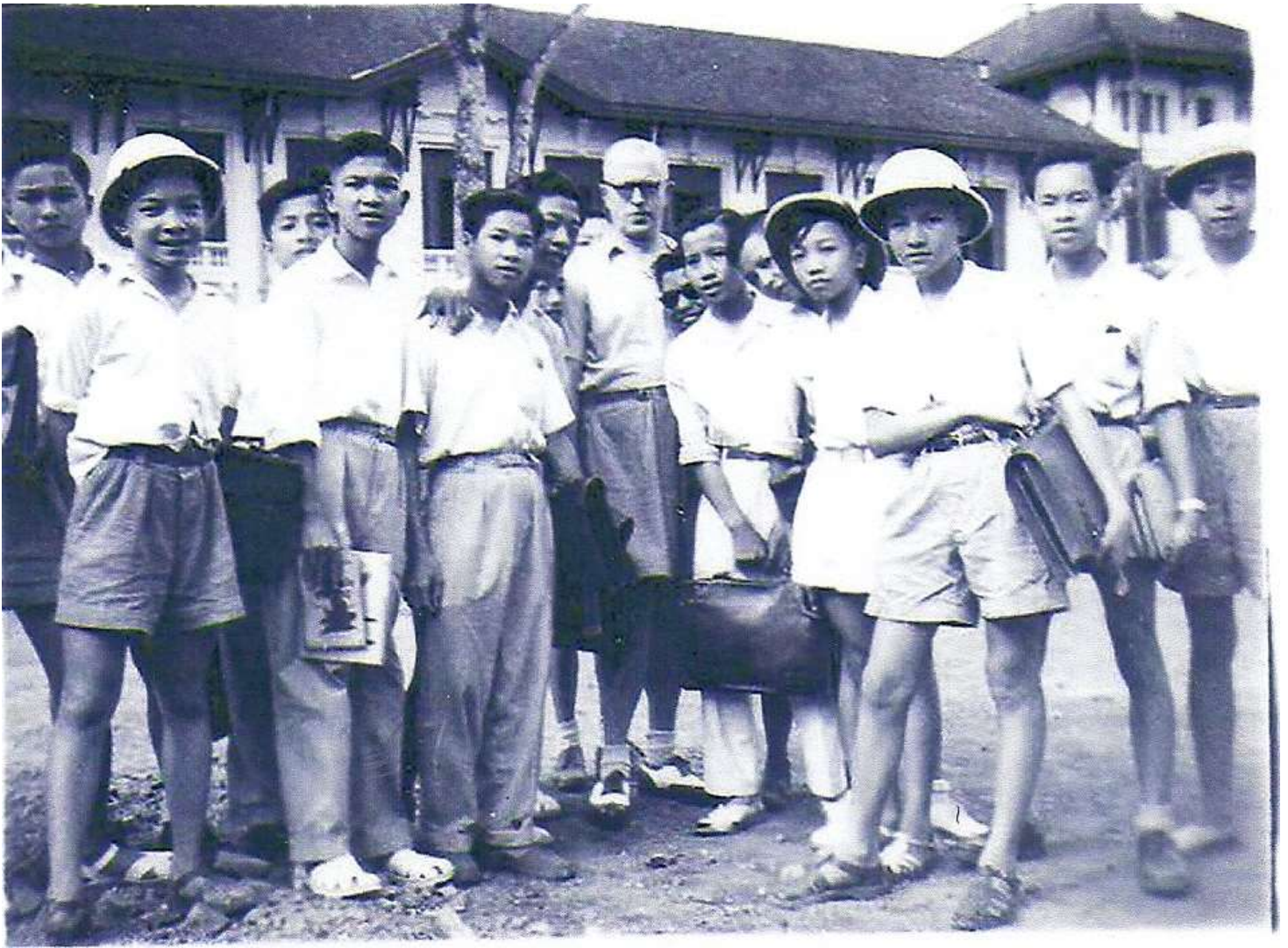
5 ème Moderne III 1949(?) Với Giáo Sư Anh Văn